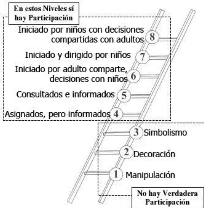
Diagrama N° 2: Escalera de la Participación propuesta por Roger Hart (1993)